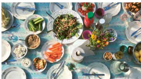
Bitte zu Tisch Fastenkalender 2023