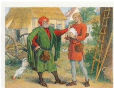
HANS IM GLÜCK

Hans hatte sieben Jahre bei seinem Herrn gedient, da sprach er zu ihm: „Herr, meine Zeit ist herum, nun wollte ich gerne wieder heim zu meiner Mutter, gebt mir meinen Lohn.“ Der Herr antwortete: „Du hast mir treu und ehrlich gedient. Wie der Dienst war, so soll der Lohn sein.“ und gab ihm ein Stück Gold, das so groß als Hansens Kopf war. Hans zog sein Fuchlein aus der Tasche, wickelte den Klumpen hinein, setzte ihn auf die Schulter und machte sich auf den Weg nach Hans. Wie er so dahinging und immer ein Bein vor das andere setzte, kam ihm ein Reiter in die Augen, der frisch